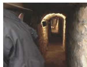
Rund 50 Meter kann man in den Berg hinein

Ein Teil des Tunnels ist Besuchern auf einer geführten Tour zugänglich. Rund 50 Meter kann man in den engen Tunnel aus Naturstein vordringen. Auf jeden Fall lohnt sich eine Führung bei den einheimischen Wanderführern. Sie begleiten Gruppen zwischen 10-20 Personen, treffen aber auch Einzelabsprachen. Die Teilnahme kostet 2,50 Euro pro Person. Durch die Kombination von Wanderung durch die schöne Landschaft der nördlichen Eifel, Technikerklärungen aus dem Mittelalter und der Besuch der Tunnelanlage wird die Wanderung im Schatten der alten Burg zu einem besonderen Ausflug.