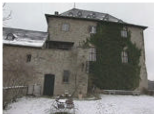
Burg Blankenheim ist Teil der Wanderung

Der Tiergartentunnel: Die Burg aus dem 12. Jahrhundert bekam 1468 ein für die damalige Zeit einzigartiges Wasserleitungssystem. Holzrohrleitungen führten zu der einen Kilometer entfernten Quelle. Da aber keine reine Gefälleleitung gebaut werden konnte, wurde eine Druckleitungsstrecke entwickelt - einmalig für das Mittelalter.